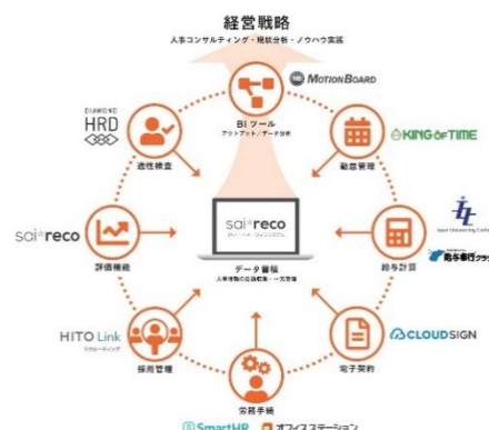
【HR コックピット概要図】

現在パートナー企業とともに、タレントマネジメントのオートメーション化を実現し、人事領域のデジタルトランスフォーメーションを支援するタレントオートメーションパッケージ「HR コックピット」の構築を進展させております。(右図参照)