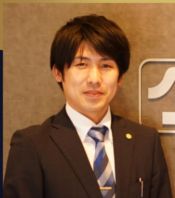
株式会社タカヤ 総務部 主任

～2年で6倍の社員数（300名）になった企業の 成功のポイントと思わぬ苦勞とは～