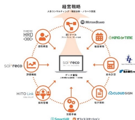
【HRコックピット概要図】

現在パートナー企業とともに、タレントマネジメントのオートメーション化を実現し、人事領域のデジタルトランスフォーメーションを支援するタレントオートメーションパッケージ「HRコックピット」の構築を進展させております。(右図参照)