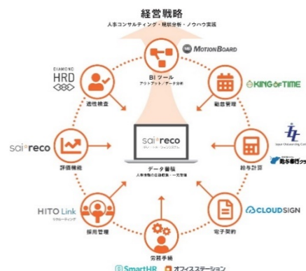
【HRコックピット概要図】