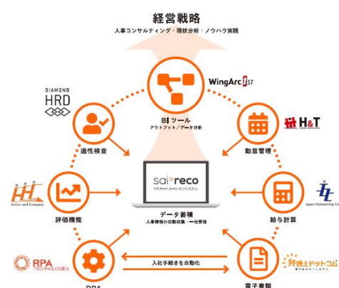
【HRコックピット概要図】