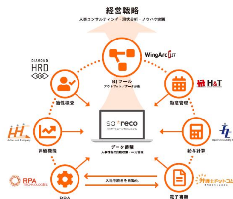
【HRコックピット概要図】